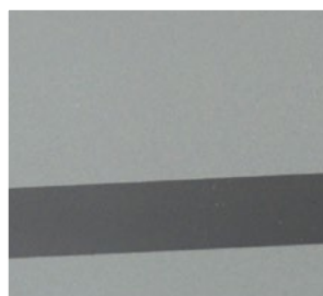
Motivglas wie abg. AL2

STANDARD – WEISS (9016) ODER ANTHRAZIT (7016) GEGEN MEHRPREIS