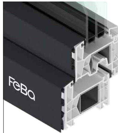
FeBa NovoLife 76 AD Fusion