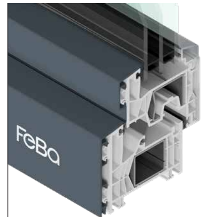
FeBa NovoLife 76 MD Fusion